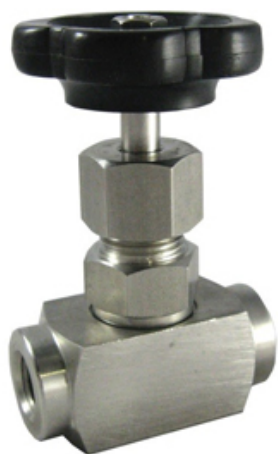
FIG.. - G - VALVOLA A SPILLO A 2 VIE GAS CIL PASSAGGIO LARGO